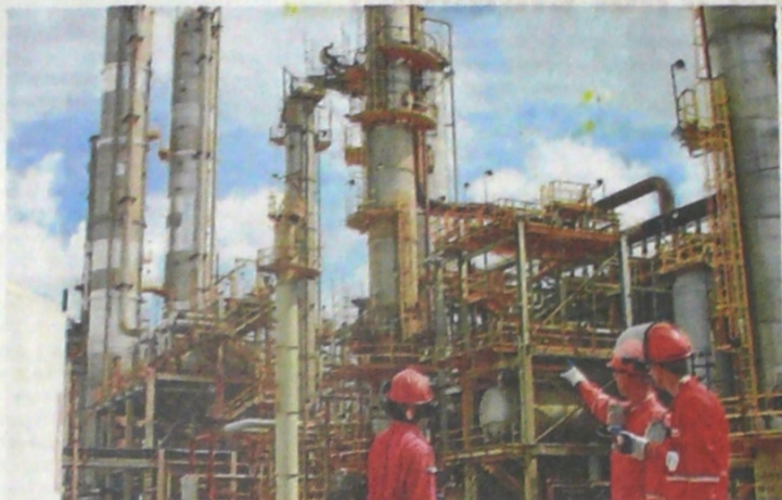
SEGÚN EL BANCO MUNDIAL, mejorar la producción de crudo tardará más tiempo, porque la estatal petrolera PDVSA ha sufrido de falta de mantenimiento y capacidad técnica.

Y finalmente se debe atender el área social, que es donde participaría el Banco Mundial junto a otros organismos, como el Fondo, el BID (Banco Interamericano de