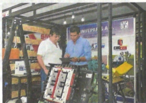
LA MUESTRA COMERCIAL tuvo la participación de compradores de varios países de la región. Las expectativas de negocios alcanzaron los $500 millones.

Durante el último día del encuentro, tuvieron lugar dos ponencias que destacaron el uso para la construcción de la