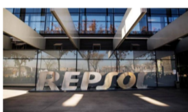
La inversión de los trabajos preliminares en ambos proyectos asciende a cinco millones de dólares.

Repsol ha suscrito contratos de exploración y producción sobre dos bloques 'offshore' en aguas de Colombia, en los que será socio de la local Ecopetrol y la estadounidense ExxonMobil, respectivamente.