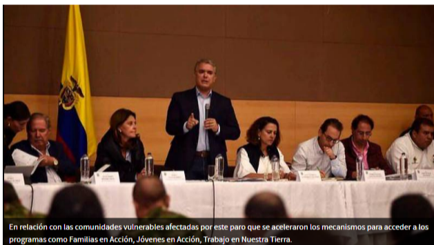
En relación con las comunidades vulnerables afectadas por este paro que se aceleraron los mecanismos para acceder a los programas como Familias en Acción, Jóvenes en Acción, Trabajo en Nuestra Tierra.

COLPRENSA | @EUUniversalCtg | 07 de abril de 2019 04:07 PM |