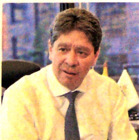
Por Bruce Mac Master