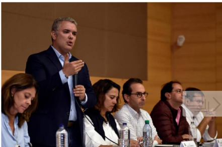
Duque anunció paquete de medidas económicas para afectados por bloqueos

El presidente de Colombia, Iván Duque, anunció este domingo un paquete económico que incluye créditos y alivios fiscales para ayudar a los comerciantes afectados por la protesta de indígenas que durante 27 días bloquearon la Vía Panamericana, la más importante del suroeste del país.