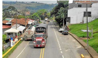
Vista de la vía Panamericana a la altura de Mondomo (Cauca).

1 1 0 0 Share Share Tweet Email Lunes, Abril 8, 2019 lapatria.com