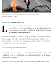
Sección de Cauca, el 12 de marzo manifestantes bloquearon la vía Panamericana.

Por PORTAFOLIO - en el sector comercio. Las autoridades habilitaron en las últimas horas una vía alterna a la carretera Panamericana, que consistió por parte de Colombia entre sí y que permitieron el paso de los vehículos que se detuvo hace más de 20 días por protestas indígenas.