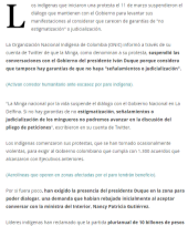
Los indígenas exigen al gobierno colombiano que cumpla con 1.300 acuerdos que alcanzaron con gobiernos anteriores.

Por PORTAFOLIO - en el sector comercio. Los indígenas que iniciaron una protesta el 11 de marzo suspendieron el diálogo que mantenían con el Gobierno para levantar los manifestaciones al considerar que carecen de garantías de "no estigmatización" y judicialización.