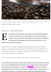
Cinco paquetes de medidas que el Gobierno responde a la emergencia económica ocasionada por la protesta que llevó al Consejo Regional Indígena del Cauca (CRIC) que finalizó ayer con un acuerdo con el Gobierno.

Por PORTAFOLIO - en el sector comercio. El presidente de Colombia, Iván Duque, anunció este domingo un paquete económico que incluye créditos y alivios fiscales para ayudar a los comerciantes afectados por la protesta de indígenas que durante 27 días bloquearon la Vía Panamericana, la más importante del sureste del país.