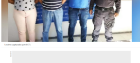
Los tres capturados por el CFI.