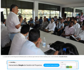
La sesión del Comité Regional de Monitoreación se efectuó ayer entre las 7 y 8 de la mañana y las 12 del mediodía. Davidte Rache