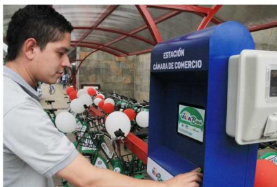
Cada una de las siete estaciones tendrá un dispositivo electrónico, con huella dactilar, para poder disponer del préstamo de la bicicleta.

El sistema le brinda un tiempo de una hora para poder usar la bicicleta que son anti vandálicas, anti pinchazos, tiene seis velocidades, luces, guardabarros y una guaya de seguridad.