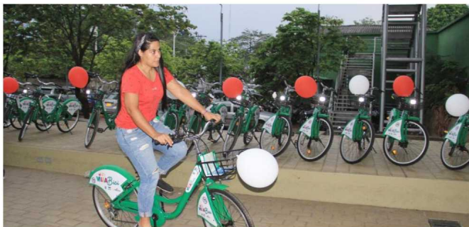
Las bicicletas ya están disponibles en la estación de la Cámara de Comercio de Villavicencio.

Estarán disponibles en siete estaciones electrónicas con huella digital que se construyen.