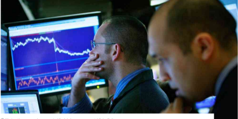
Alta tensión en mercado por eventual final de la guerra comercial.

Los mercados tuvieron un comportamiento mixto en una jornada donde los inversionistas se mantuvieron a la expectativa de los avances en el acuerdo comercial entre China y Estados Unidos.