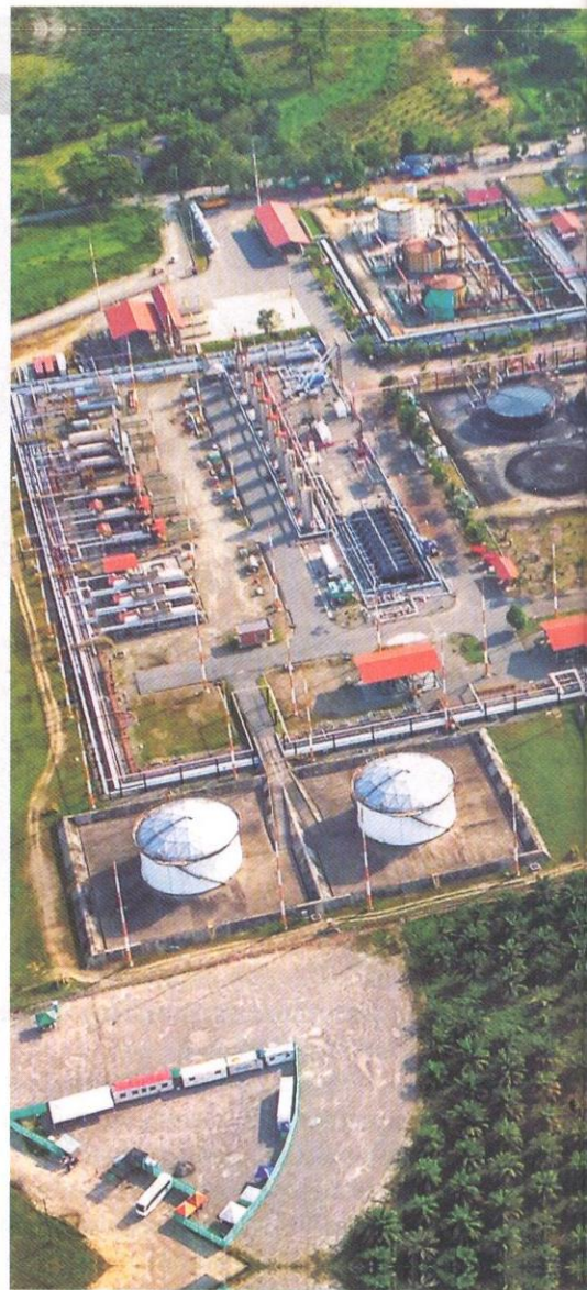
La compañía está a la expectativa de iniciar sus pilotos en fracking.

PDVSA PASA POR SU PEOR MOMENTO; PEMEX BUSCA SALIDAS A LA CRISIS; PETROBRAS SE RECUPERA Y YPF MUESTRA BUENOS RESULTADOS.