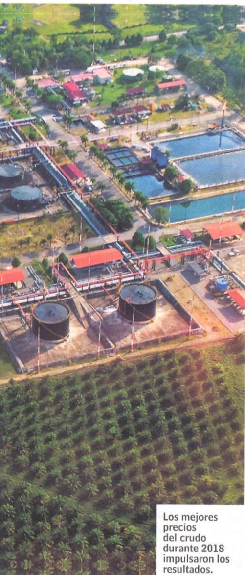
Los mejores precios del crudo durante 2018 impulsaron los resultados.

mayores cantidades producidas y tiene un billonario plan de inversiones que incluye, si el Gobierno autoriza, US$500 millones para proyectos pilotos en exploraciones de hidrocarburos no convencionales, es decir, el fracking en Colombia.