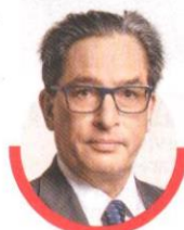
Alberto Carrasquilla Ministro de Hacienda