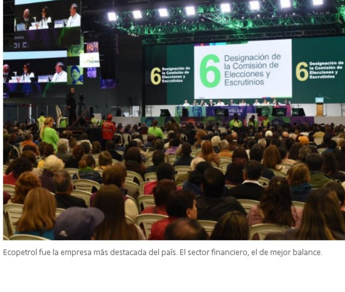
Ecopetrol fue la empresa más destacada del país. El sector financiero, el de mejor balance.

POR: PORTAFOLIO - ABRIL 02 DE 2019 - 09:34 P.M.