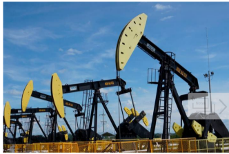
Ecopetrol y canadiense Parex firmaron tres contratos de exploración y producción.

La Agencia Nacional de Hidrocarburos (ANH) autorizó la suscripción de tres contratos de cesión entre Ecopetrol y la firma canadiense Parex para la exploración y producción de los convenios 'Aguas Blancas', 'Boranda' y 'De Mares', ubicados en el Valle del Magdalena Medio.