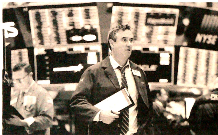
En Estados Unidos, los principales índices se valorizaron más de 10 por ciento.

Aunque el mercado no está en el punto máximo de este año, pues la valorización alcanzó a rondar el