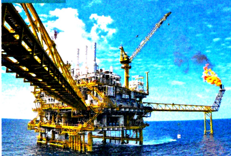
Los países de la Opep acordaron reducir el bombeo en 1,2 millones de barriles diarios.