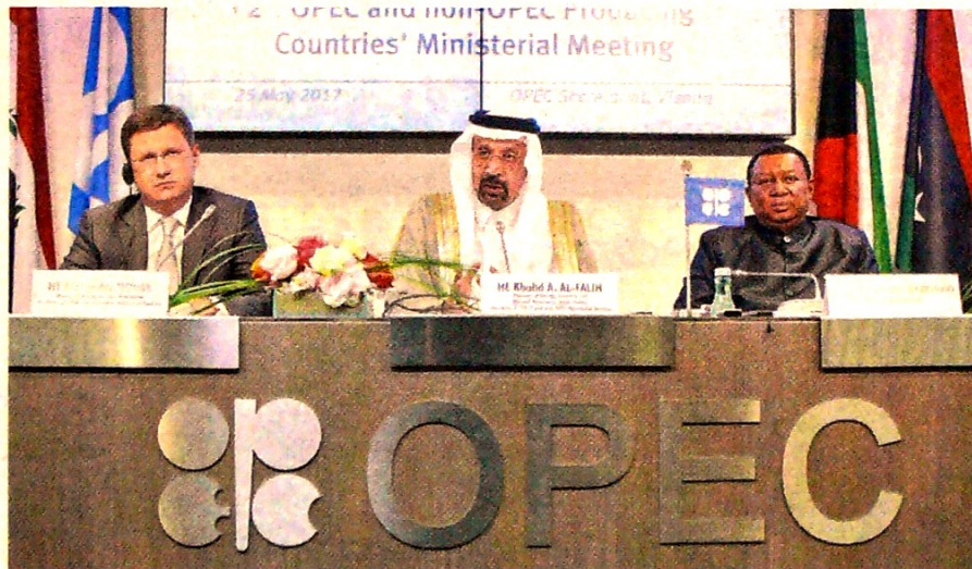
La Opep y sus aliados empezaron a aplicar los recortes de producción desde enero.

“Puntualmente, la debilidad económica debería hacer que el precio del petróleo descendiera por la menor demanda que esto genera,