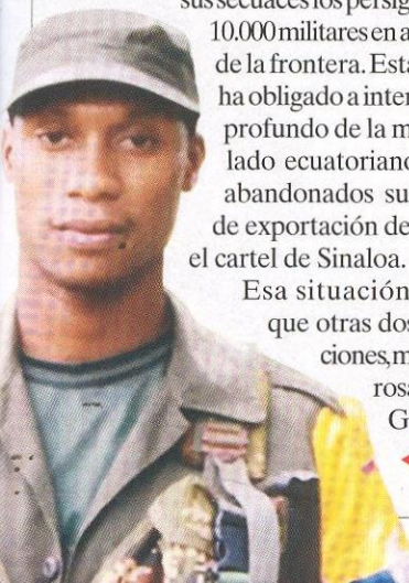
◀ Alias Guacho

Este tipo de acciones para llevar tras las rejas a estos peligrosos capos ascendentes son importantes. Pero el mayor reto de las autoridades consiste en impedir que surjan personajes como Guacho. ■