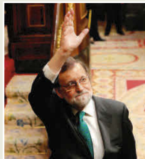
Mariano Rajoy, primer presidente del gobierno español destituido.