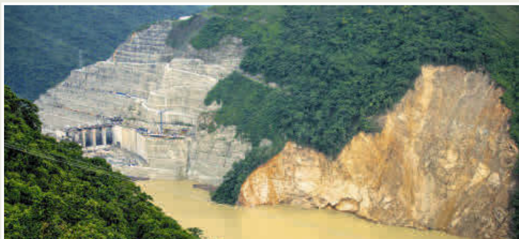
Las grietas de la montaña donde se construye Hidroituango siguen generando incertidumbre para los cientos de familias que permanecen evacuadas.